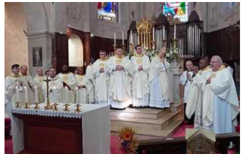
Diocèse de Gap-Embrun