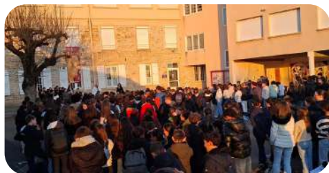
Hommage de l'école Saint Vincent à Ferney-Voltaire