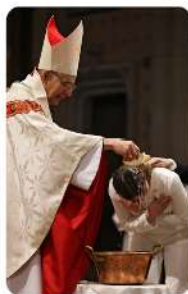
Baptême à Belley - 2024

Les lycéens et jeunes adultes qui reçoivent le baptême à Pâques, de plus en plus nombreux, dans notre diocèse comme dans tous les autres diocèses de France, témoignent de la puissance de renouvellement de l'Évangile. Ils manifestent avec force et beauté ce qu'est la vie chrétienne : un rejet ferme de tout ce qui conduit à la mort ; l'accueil décisif du salut en Jésus-Christ par la foi ; et la joyeuse renaissance dans l'Esprit Saint.